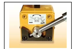
Palanca amb bloqueig de seguretat.

NOTA: El coeficient de seguretat és de 3. La força de despreniment és 3 vegades més gran que la càrrega d'utilització.